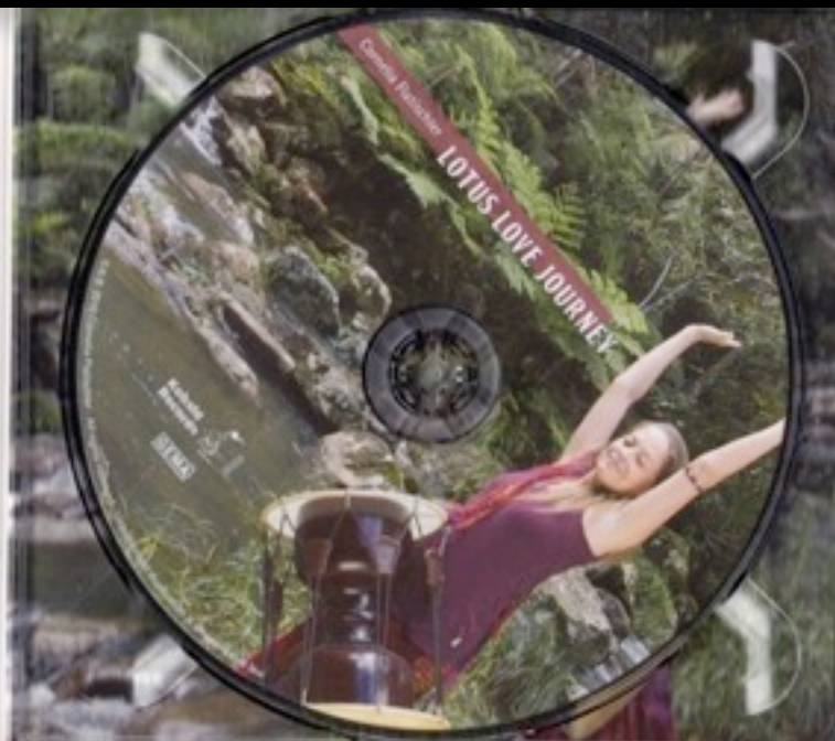
Images for CD booklet, shot in the Byron Bay Hinterland Australia